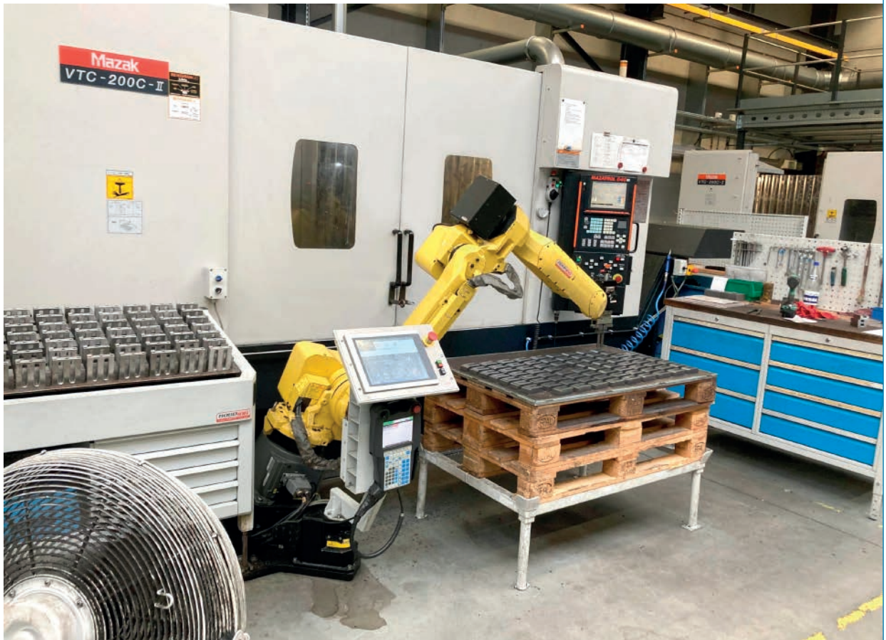
Stubbe was een van de eersten die, in cocreatie met RoboJob, inzetten op robotisering voor kleinere series van eenvoudige stukken

stap wordt digitaal in kaart gebracht, offline voorbereid en opgevolgd.